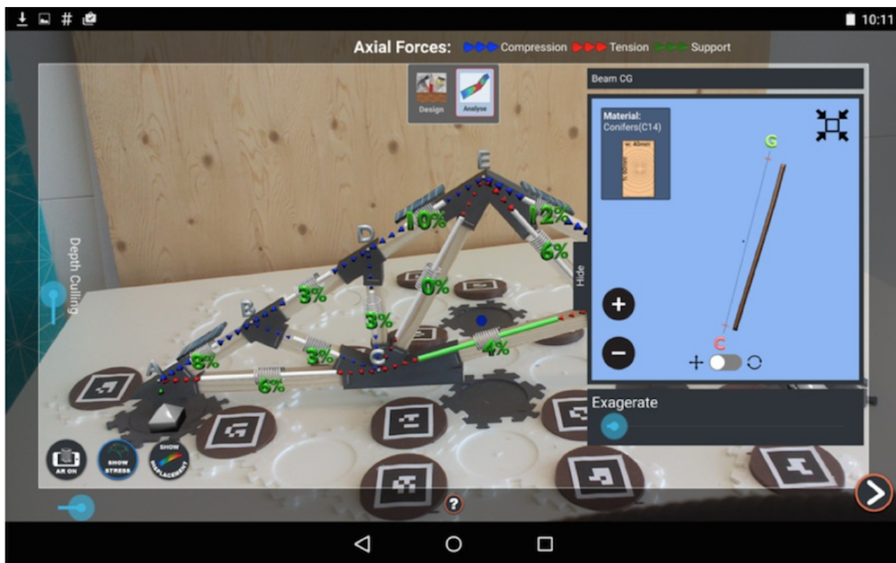
Augmented-Reality-Schnittstelle für einen intuitiven Zugang zur Statik.

Nehmen wir ein zweites Beispiel, diesmal im Bauwesen. Wir haben ein Augmented-Reality-Tool für den Statikunterricht von Zimmerleuten entwickelt, das es ermöglicht, die Ausbreitung der Kräfte in den Balken eines Dachstuhls intuitiv, ohne mathematische Formeln, zu verstehen. Das Tool basiert auf einer Fotografie des Dachstuhls, der sich auf der Baustelle befindet, auf welcher der Lernende arbeitet. Ja, es existieren Unterschiede zwischen dem, was man in der Schule tun kann, und dem, was im Betrieb möglich ist. Identifizieren und nutzen wir sie!